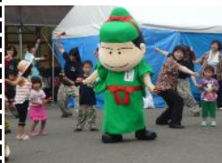
わし麻呂くんも踊る♪ よさこいソーラン!

6月16日道の駅感謝祭が「もてなし家」で開催されました。 恒例の地元野菜や交流物産販売、アトラクションではスコープ三味線、よさこいソーランや太鼓などの演奏、金魚すくい。餅つきには長岡技科大、造形大の太鼓の若者が挑戦。慣れないしぐさのへっぴり腰に笑いを誘い。つきたてのお餅とだんご汁のふるまいに舌鼓を打つ楽しい一日となりました。