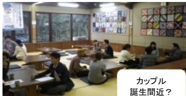
カップル誕生間近？