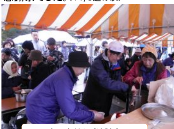
商工会だんご試食

雨と風でアトラクションの一部を中止する悪天候の中、和島の郷土料理「だんご汁」で地域を活性化したいという和島村商工会企画のだんご汁3種類300杯の試食。和島村建築組合の模擬上棟式、商工会青年部の飲食コーナーや雨の中めげずに頑張ってくれたスコープ三味線の演奏などで最後まで盛り上がった感謝祭でした。(11/3道の駅)