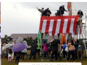
模擬上棟式で餅まき