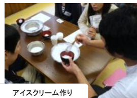
アイスクリーム作り