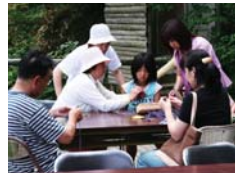
ラベンダースティック教室