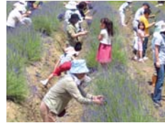
ラベンダー花摘み