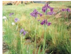
ホテル水路脇に植えた アヤメ

ラビットファームでは、6月と7月がラベンダーの季節。ハサミを入れ、一本一本つんでゆく楽しさはハーブの世界そのもの！ 美しい花の香りをかいだ時の幸福感をぜひ味わってみてください。ご家族一緒でお出かけになりませんか？