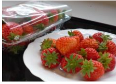
越後姫(寺泊産) 道の駅名物 完熟朝採り