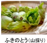
ふきのとう(山採り)