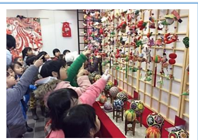
越後の春を呼ぶつるし雛まつり

通信 : vol 170号 発行:平成31年1月21日 長岡市指定管理者:NPO法人和島夢来考房