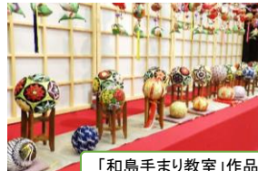
「和島手まり教室」作品展