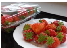
越後姫(寺泊産) 道の駅名物 完熟朝採り