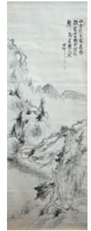
長井雲坪「水墨山水図」