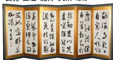
天来書 六曲屏風 「酌酒与……」