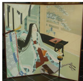
作者不明「紫式部他 人物図」