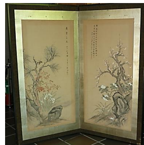
富取清旭 絵「歳寒三友図」