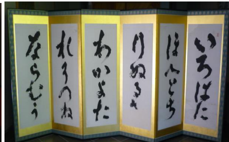
高橋泥舟 書「いろは...」他