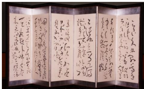
良寛書 漢詩「生涯懶立身...」他