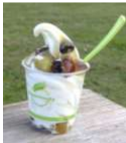
焼いもサンデー 600円