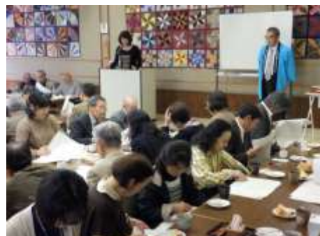
選者による発表風景 R1,10,27 和らぎ家

良寛ゆかりの地、柏崎市・出雲崎町をバスで巡りながら作り上げた作品を出雲崎町教育委員会で取りまとめ、和島で俳句・短歌それぞれの選者が審査し、結果発表会と表彰式が開催されました。ツアー参加者は良寛の里美術館見学と道の駅での買い物を楽しみ、帰路につかれました。