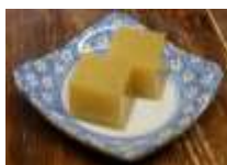
焼いもようかん 200円