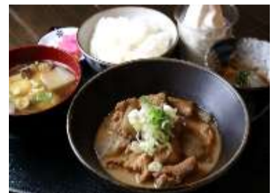
1,450円 (だんご汁+おぼろ豆腐+ガンジーソフト付) もつ煮込み定食 800円(吸い物付き) もつ煮込み単品 600円