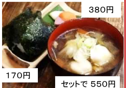
170円 セットで 550円