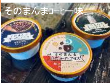
良寛コーヒーアイス 270円