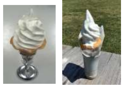
コロネソフト 450円 コロネソフト 650円