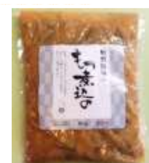
1パック 1,350円 要冷蔵 800g (2～3人前)

調理方法 パックのままお湯で温めるだけで食べられます。豆腐やねぎ等を加えると更に美味しくなります。