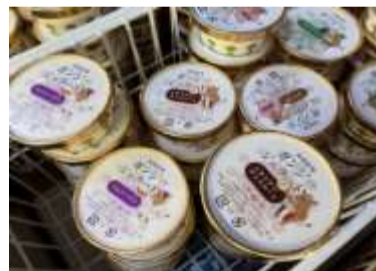
ガンジージェラート 375円