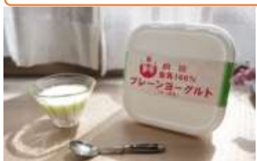
良寛プレーンヨーグルト(1kg)