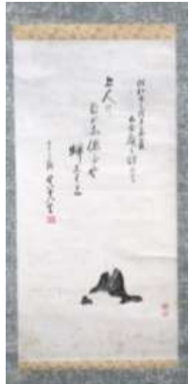
高村真夫 「画讚 良寛像と和歌」 (長岡市立中央図書館蔵)

◆道の駅では 感染防止のため・マスク着用・手指の消毒・検温・マイバック持参・買い物された商品の袋詰めをお願いしています。