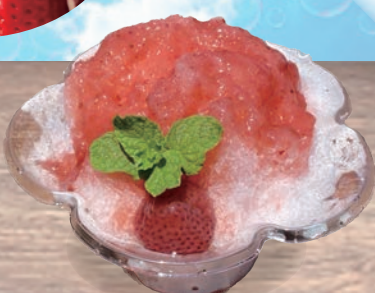
完熟越後姫ソース