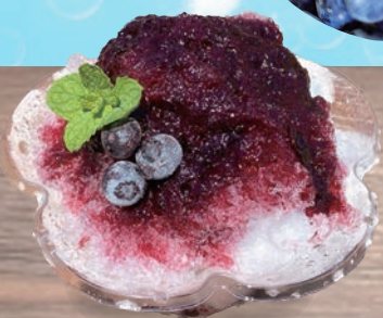
完熟ブルーベリーソース