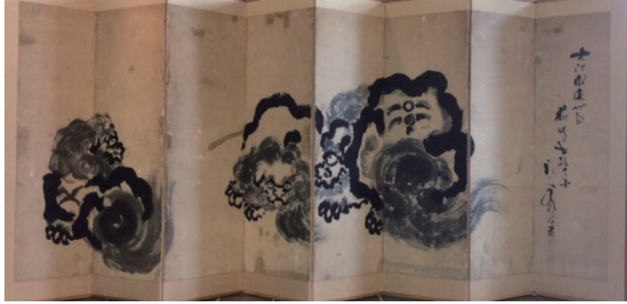
有願「唐獅子」(個人蔵)

会期：令和5年5/27(土)～7/16(日) 入館料：大人500円、小人300円 会場：良寛の里美術館 時間：9:00～17:00