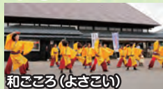
和ごころ(よさこい)