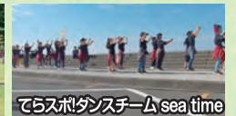
てらスボダンスチーム sea time