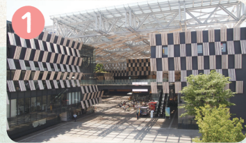
1 ながおか まちの駅 アオーレ長岡・ながおか市民協働センター