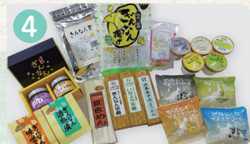
4 ぎんなんアイスクリームの駅 (有)山岸モータース・小国町特産品