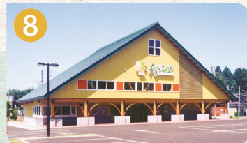
8 まちの駅 あぐりの里 道の駅 越後川口 あぐりの里