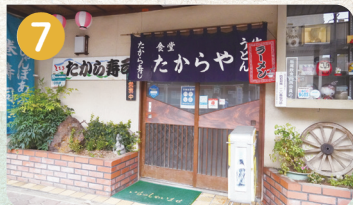
7 あぶらげ巻き寿司の駅 食堂たからや