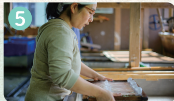
5 和紙の駅 おぐに和紙の店