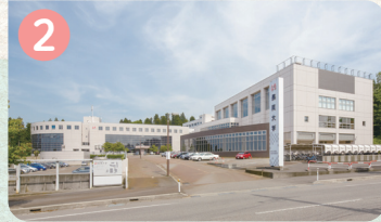
2 まちの駅 長岡大学 長岡大学