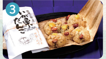
3 まちの駅 菓子処 越後物語 (株)西山製菓