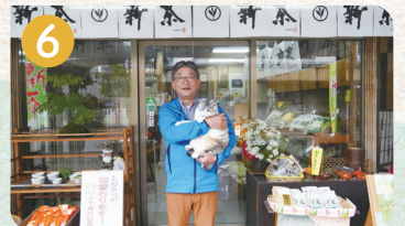
6 日本茶の駅 広野茶店