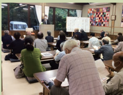
和室はひろびろ 40 畳