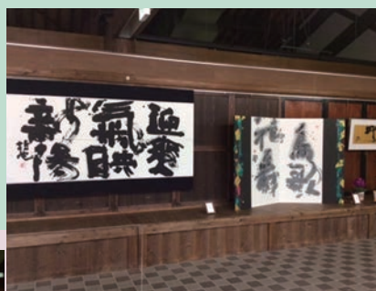
昔ながらの板戸を活かした ギャラリースペース