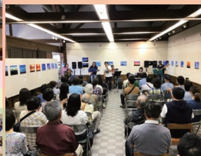
ホールではコンサートもできます