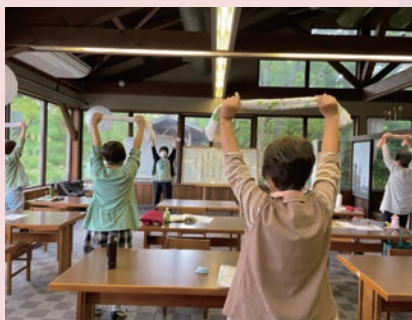
明るい光が差し込むテーブル席