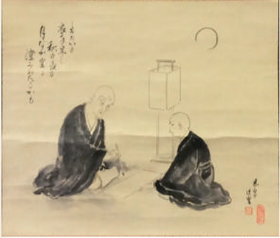
宮田慈泉 「良寛貞心尼初対面の図」 個人蔵