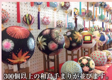
300個以上の和島手まりが並びます。