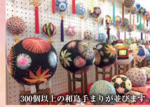
300個以上の和島手まりが並びます。