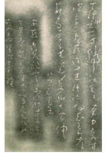
良寛 「生涯身を立つるに懶く…」 乙子神社境内歌碑より

【出展者】 見附市拓本同好会 【拓本採取石碑】 出雲崎町、燕市、 長岡市和島、与板 他