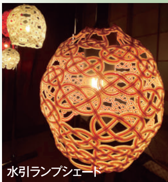
水引ランプシェード