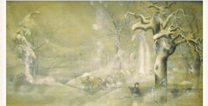
今井爽邦「冬の道」 大幅 140×229cm